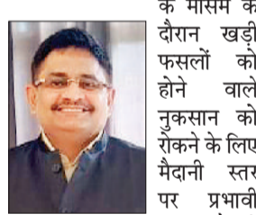
मुख्य अभियंता बीएस नारा

रोहतक। सिंचाई विभाग के मुख्य अभियंता बीएस नारा ने प्रभावी बाढ़ तैयारी हेतु रोहतक, भिवानी, झज्जर अधीक्षण अभियंताओं को निर्देश दिए हैं। उन्होंने कहा है कि मानसून के दौरान खड़ी फसलों को होने वाले नुकसान को रोकने के लिए मैदानी स्तर पर प्रभावी बाढ़ तैयारी महत्वपूर्ण है। 30 जून तक हरियाणा में दक्षिण-पश्चिम मानसून आने की उम्मीद है। इसलिए अधिकारी 25 जून तक अपने अधिकार क्षेत्र के तहत आने वाली पूरी नहर और ड्रेन नेटवर्क की सफाई करवाएं। सभी बाढ़ योजनाओं को धरातल पर पूरा करने की समय सीमा 30 जून तक की गयी है। ताकि किसानों को लाभ मिल सके।