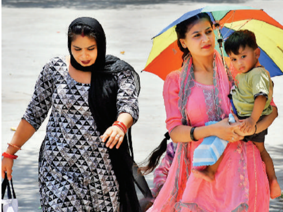
रोहतक। भीषण गर्मी से बचने के लिए छाते का सहारा लेती महिला।