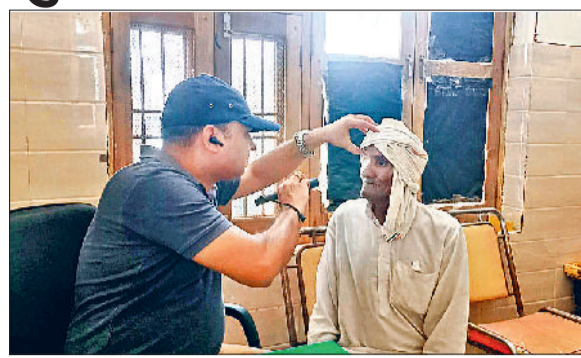
रोहतक। आंखों की जांच करते हुए डॉक्टर।