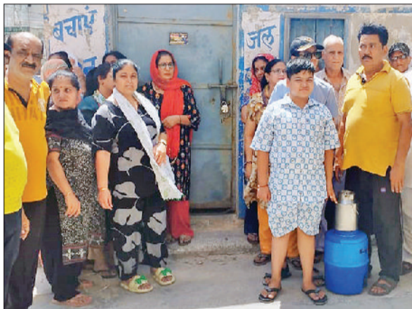
रोहतक। जुलाहा वाला चौक स्थित बूस्टर पर ताला जड़कर रोष जताते सलारा मोहल्लावासी एवं खाली बालटी दिखाते हुए मोहल्ला निवासी।